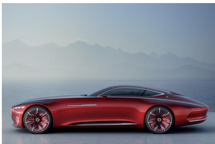
Vision Mercedes-Maybach 6 Coupé