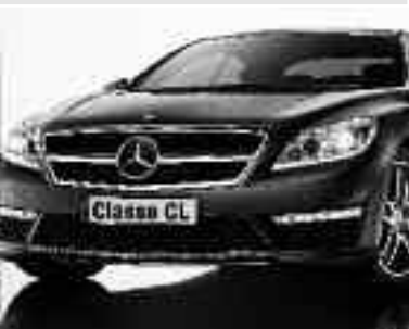
CL 63 AMG avec grille de calandre ▲ spécifique à une lamelle