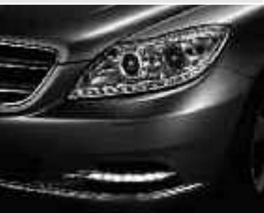
Projecteurs bi-xénon avec ILS (Intelligent Light System) et feux de jour à LED ▲