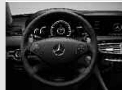
▲ Volant sport ergonomique AMG avec palettes de commande de boîte argentées en aluminium