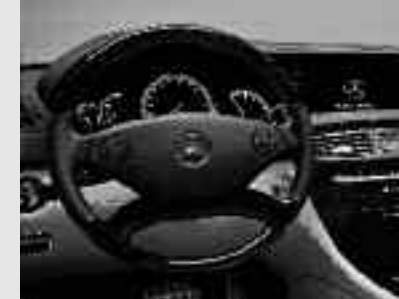
▲ Volant cuir et bois