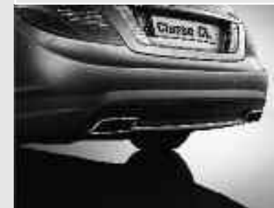
▲ Jupe arrière du Pack Sport AMG