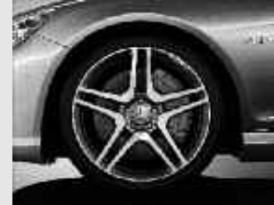
▲ Jantes alliage AMG 51 cm (20") design 5 doubles branches, finition gris titane poli