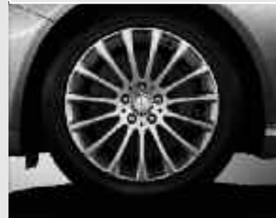
Jantes alliage 46 cm (18") ▼ design 15 branches