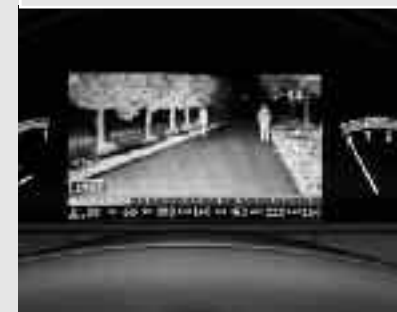
▼ Vision de nuit PLUS avec protection piéton