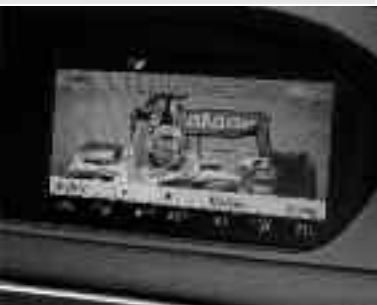
Affichage SPLITVIEW ▲