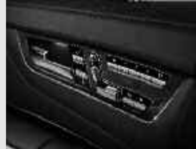
▲ Sièges avec fonction Mémoires