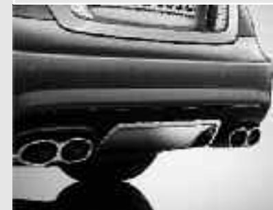
▲ Échappement sport AMG avec deux doubles sorties chromées design V12