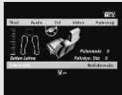
▲ Sièges avant multicontours actifs