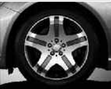
Jantes alliage 46 cm (18") ▲ design V12