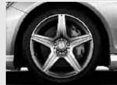
▲ Jantes alliage AMG 48 cm (19") design 5 branches