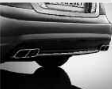
Échappement avec deux doubles sorties chromées design V12 ▼