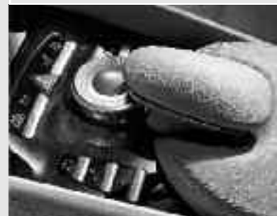
▲ COMAND Controller