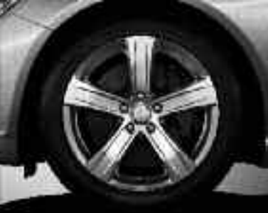
Jantes alliage 46 cm (18") ▲ design 5 branches