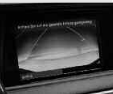
Stationnement guidé APG (Advanced Parking Guidance) ▼