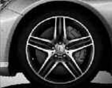
Jantes alliage AMG 48 cm (19") ▲ design 5 triples branches