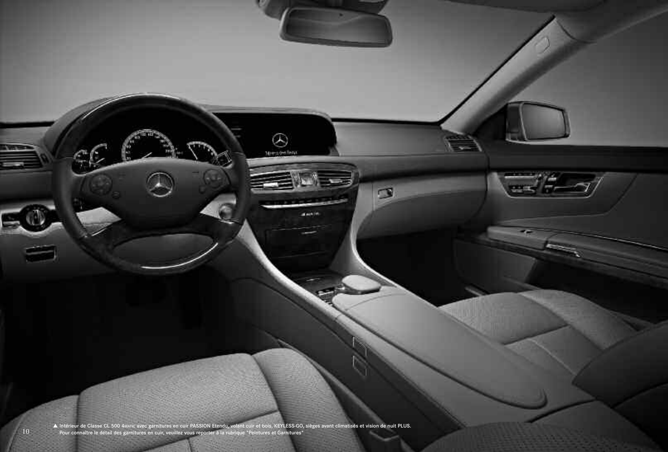
▲ Intérieur de Classe CL 500 4MATIC avec garnitures en cuir PASSION Etendu, volant cuir et bois, KEYLESS-GO, sièges avant climatisés et vision de nuit PLUS. Pour connaître le détail des garnitures en cuir, veuillez vous reporter à la rubrique "Peintures et Garnitures"